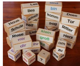
Erweiterungspaket nicht nur für Klassen 1 und 2